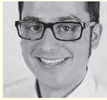
Robert Schlegel Ministerium für Umwelt, Klima und Energiewirtschaft